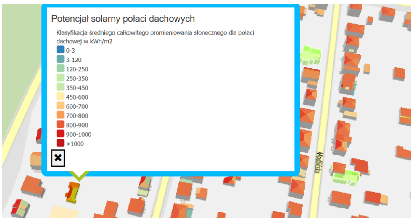
RYSUNEK 3. MAPA POTENCJAŁU SOLARNEGO POZNANIA