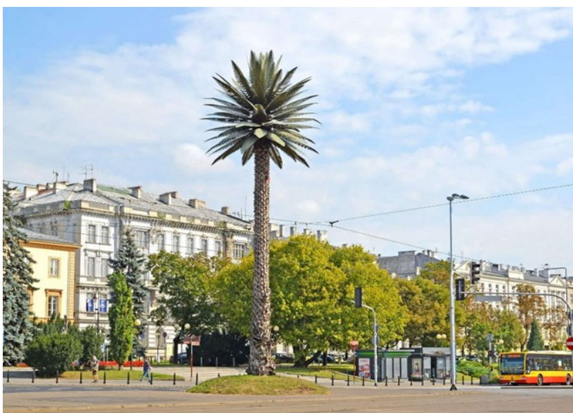
RYSUNEK 3. INSTALACJA ARTYSTYCZNA „POZDROWIENIA Z ALEJ JEROZOLIMSKICH”